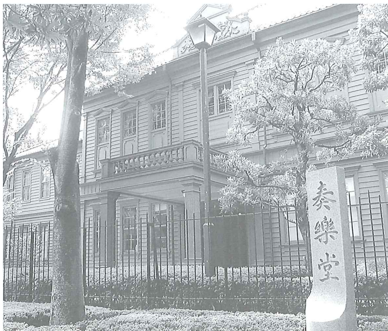
旧東京音楽学校奏楽堂(重要文化財) 現在は改修工事のため休館しております。 再開は平成30年度の予定です。