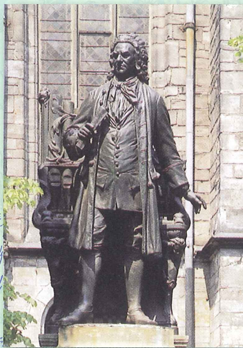
トーマス教会前に立つバッハ像